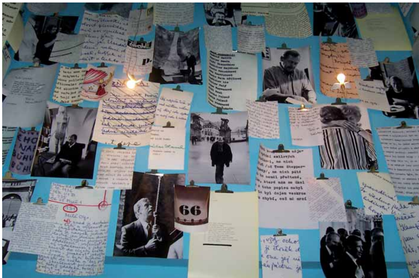
Expozice Knihovny Václava Havla / The Exhibition of The Václav Havel Library