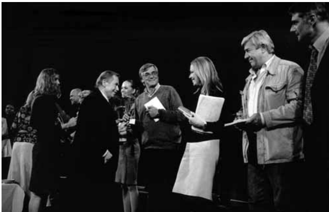
Spiklenci / The Conspirators © Oldřich Škácha

The successful public reading of the Conspirators was followed in October by the Verbally More cycle (Ústně více), which acquainted the audiences with the works of Václav Havel as they arose throughout the individual decades over a total of six evenings. The aim of these evenings was to acquaint the audience members with the development of Czech culture and political events from the 1950s to the present, as reflected in the works of Václav Havel and the authors who are close to him. Many socio-political