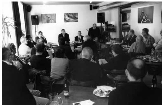
Amálie, září 2007 / Amalia, September 2007