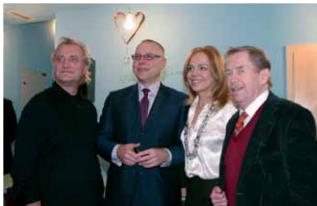
Božek Šípek, Zdeněk Bakala, Dagmar a Václav Havlovi (Slavnostní otevření Expozice Knihovny Václava Havla / Opening ceremony of the Exhibition of The Václav Havel Library)