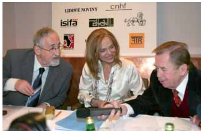
Miloslav Petrušek, Dagmar a Václav Havlovi (Slavnostní otevření Expozice Knihovny Václava Havla / Opening ceremony of the Exhibition of The Václav Havel Library)