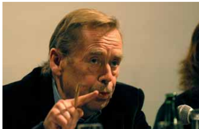
Václav Havel (Amálie, listopad 2007 / Amalia, November 2007)

The discussions were initiated by Václav Havel and they were moderated by Michael Kocáb as usual.